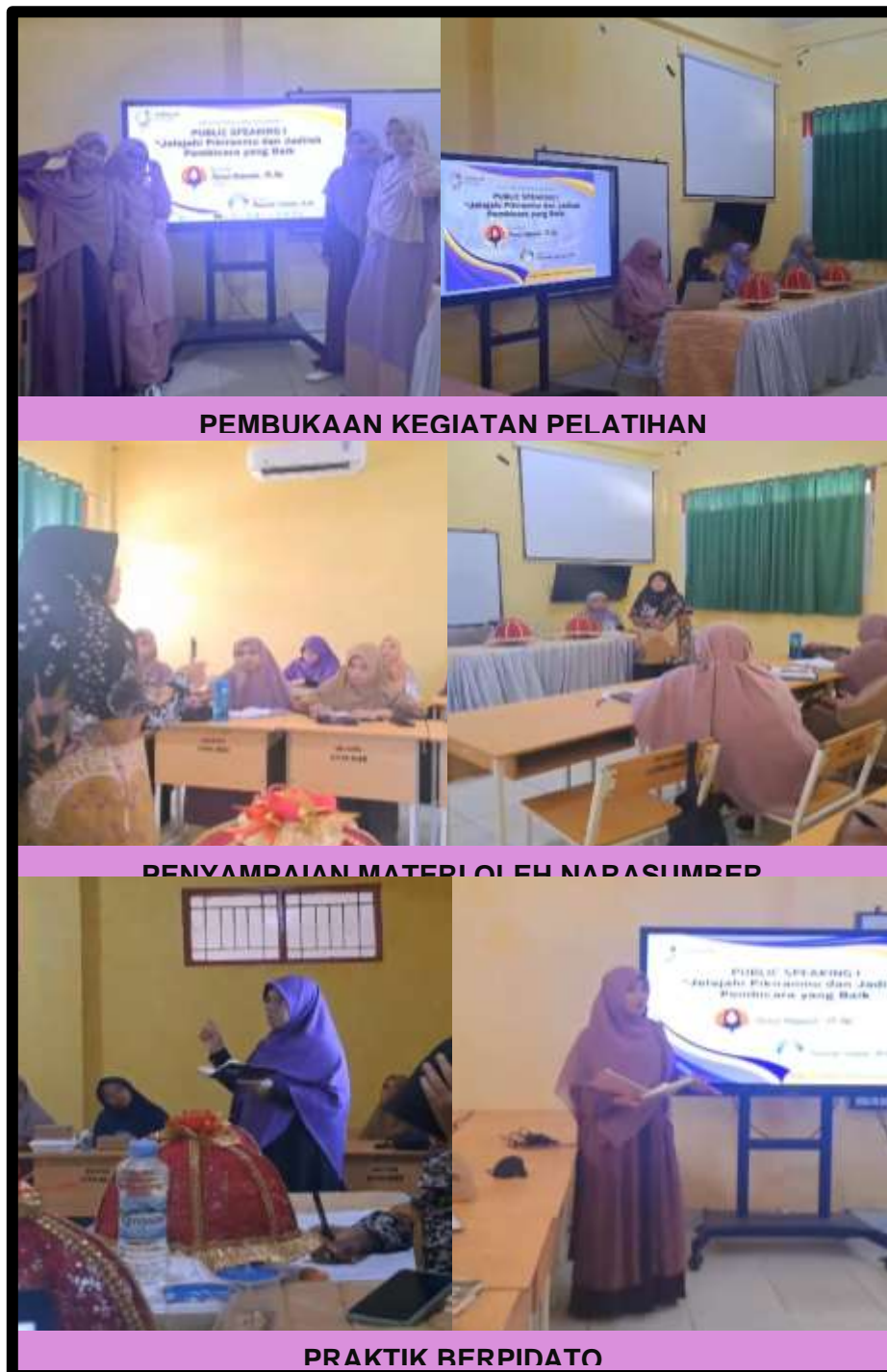
Gambar 1. Dokumentasi Kegiatan Pelatihan Public Speaking

Pada tahap pelaksanaan, pelatihan public speaking dibagi menjadi beberapa sesi yang terstruktur dengan baik, memberikan ruang bagi peserta untuk belajar secara bertahap dan terfokus. Metode pengajaran yang digunakan tidak hanya terbatas pada teori, tetapi juga menekankan pada praktik langsung melalui simulasi pidato. Simulasi ini dirancang