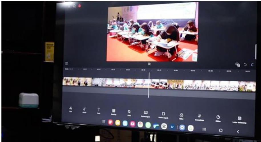
Gambar 4 Proses Editing Video Profil

Gambar 3 merupakan diskusi dengan peserta pelatihan pembuatan video profil dan perkenalan dengan peserta dengan instruktur, menjelaskan bahan dan alat yang digunakan pada pelatihan pembuatan ini.