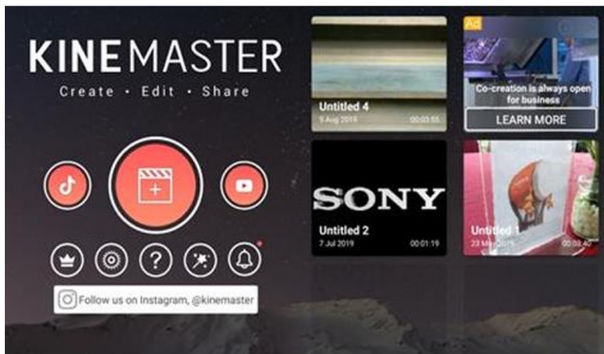
Gambar 2 Tampilan Aplikasi Kinemaster

Kegiatan pengabdian pada masyarakat ini menggunakan alat dan bahan antara lain: (a) kebutuhan perangkat keras berupa personal komputer 15; (b) kebutuhan perangkat lunak berupa Aplikasi Filmora [6] untuk editing video.