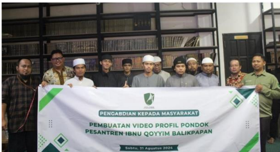
Gambar 5 Penutupan Pelatihan Editing Video

Gambar 4 merupakan penggunaan aplikasi yang digunakan pada pembuatan video profil Pesantren Ibnu Qoyyim Balikpapan pada pengabdian masyarakat jurusan Teknologi Informasi program studi Teknik Informatika dan Multimedia.