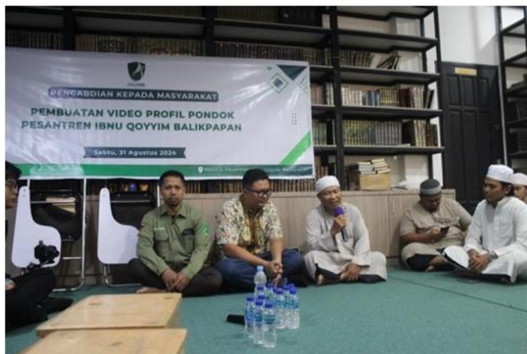
Gambar 3 Diskusi Terkait Konsep Video Profil

Dokumentasi yang disertakan menunjukkan setiap tahap dari awal hingga akhir kegiatan, berikut merupakan dokumentasi yang dilakukan selama kegiatan, pembuatan video profil pesantren.