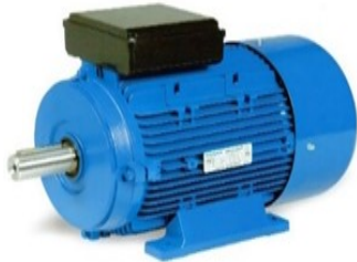
Gambar 1. Motor Listrik