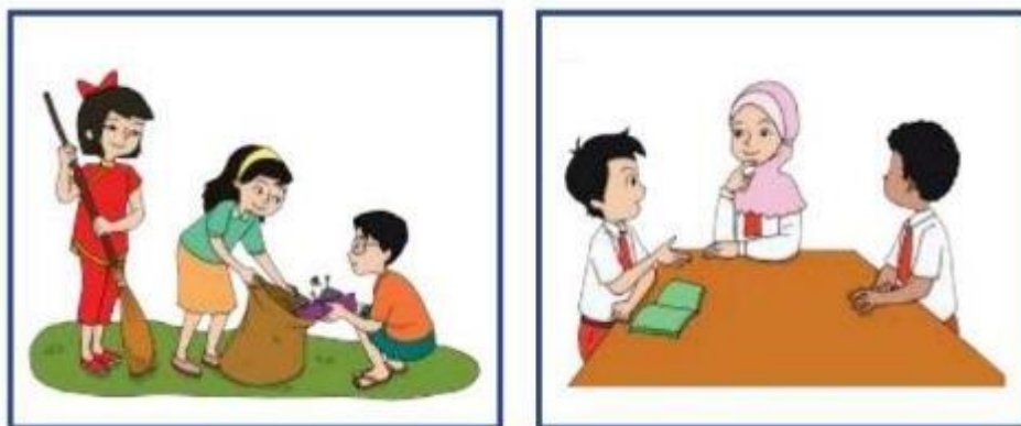
Gambar 1 Ilustrasi Cerita Pendek untuk Pembelajaran