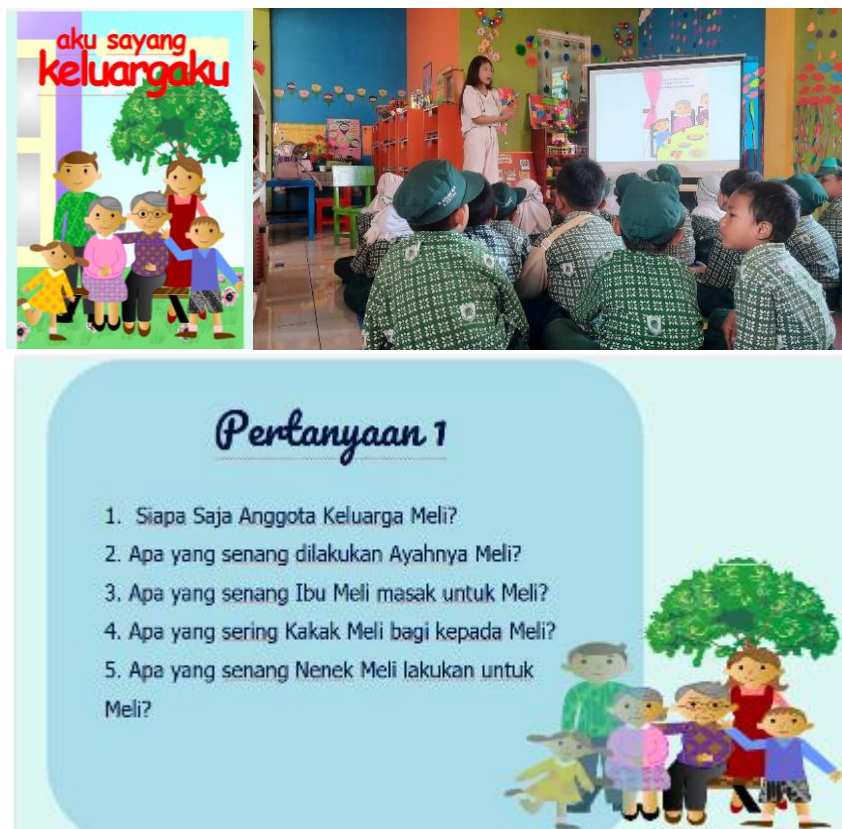
Gambar 3 Gambaran Aktivitas Pembelajaran

dan Kerjasama dalam Keluarga" dilaksanakan melalui kegiatan mendengarkan cerita pendek (cerpen) yang diikuti dengan diskusi interaktif bersama siswa, bertujuan untuk menanamkan nilai-nilai empati, kepedulian, dan kebersamaan. Selain itu, siswa juga diajak berpartisipasi dalam permainan "Membeku" yang mengintegrasikan art learning melalui akses video YouTube, di mana mereka mengikuti arahan untuk bergerak, bekerja sama, dan menunjukkan kedisiplinan. Melalui aktivitas ini, siswa tidak hanya mengembangkan kreativitas dan keterampilan motorik, tetapi juga belajar menghayati nilai-nilai persatuan dan keadilan dalam kelompok, yang sejalan dengan prinsip Profil Pelajar Pancasila.