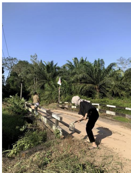
Gambar 5 Pembersihan Area Sekitar Jembatan

Memotong semak atau tanaman liar yang tumbuh di sekitar pondasi atau tepi jembatan serta membersihkan area bahu jalan atau trotoar dari sampah.