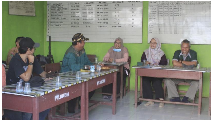
Gambar 2 Pertemuan dengan Kepala Dusun Sungai Tempurung