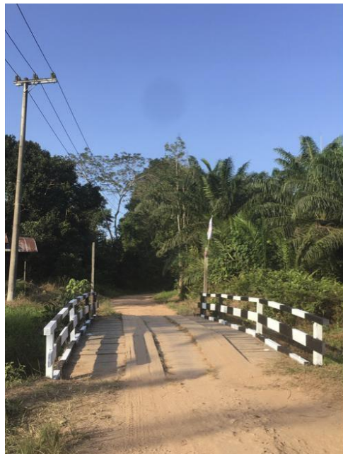
Gambar 7 Jembatan yang Selesai Direnovasi