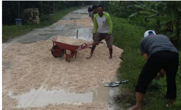
Gambar 4 Pekerjaan Penambalan Jalan Berlubang