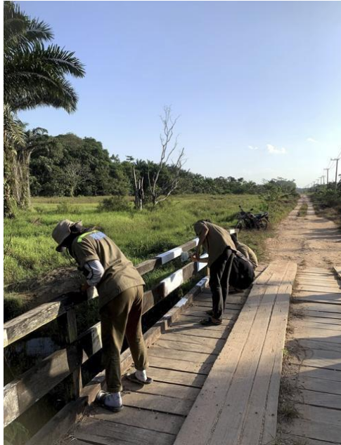
Gambar 6 Pekerjaan Pengecatan Railing Jembatan

Kegiatan ini meliputi pekerjaan pengecatan sisi luar dan dalam dari railing jembatan. Pengecatan dilakukan merata pada permukaan kayu railing jembatan.