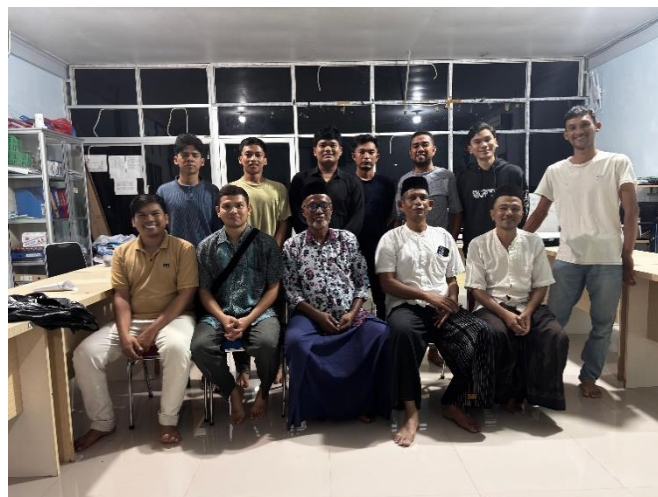
Gambar 2 Kegiatan Koordinasi

Kegiatan pengabdian bina desa dalam bentuk pembersihan lingkungan balai desa lam keumok melibatkan mahasiswa universitas syiah kuala angkatan 2022 dan aparaturnya desa lam keumok, kegiatan ini dimulai pada pukul 7 pagi hari dan di lanjutkan hingga selesai. Pada tahap awal tim melakukan koordinasi terlebih dahulu untuk musyawarah kegiatan yang akan di lakukan yaitu kerja bakti di lingkungan dengan melakukan pembersihan sampah sampah yang menumpuk di lingkungan balai desa lam keumok.