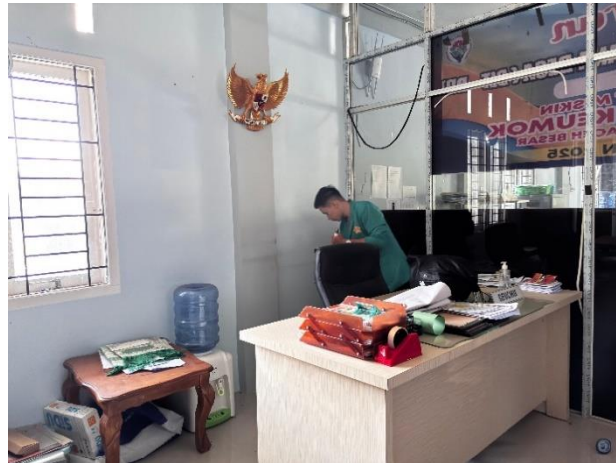
Gambar 3 Membersihkan Balai Fesa

kebersihan lingkungan memberikan pemahaman edukasi mengenai kesadaran menjaga kebersihan lingkungan pada remaja dan anak-anak desa. Hal ini merupakan bentuk partisipasi dari tim pengabdian bina desa untuk melakukan pelayanan di desa Lam Keumok. Kegiatan tersebut dapat dilihat dengan jelas pada gambar di bawah ini.