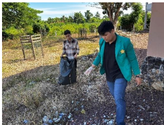
Gambar 6 Kegiatan Membersihkan Lingkungan

Dalam setiap kegiatan kerja bakti, membersihkan tempat ibadah, termasuk area wudhu, menjadi prioritas utama. Area wudhu ini tidak hanya digunakan sebelum sholat akan tetapi juga sebagai cerminan kesucian dan kekhusyukan seseorang dalam beribadah. Pembersihan area wudhu tersebut dalam aksi kerja bakti ini merupakan kegiatan nyata untuk memberikan kenyamanan kepada jamaah dalam beribadah.