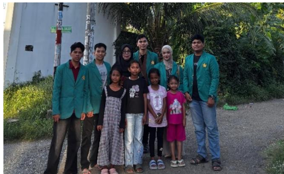
Gambar 7 Memberi Edukasi serta Pemahaman Mengenai Kesadaran Menjaga Kebersihan Lingkungan pada Remaja dan Anak-anak

Hasil dari Inisiatif ini diharapkan dapat terus berlanjut tidak hanya di dalam lingkungan mahasiswa, namun juga di kalangan masyarakat sekitar. Pesan penting yang perlu di sampaikan kepada masyarakat adalah secara umum menyadarkan masyarakat bagaimana pentingnya menjaga lingkungan sekitar dan tidak membuang sampah sembarangan.