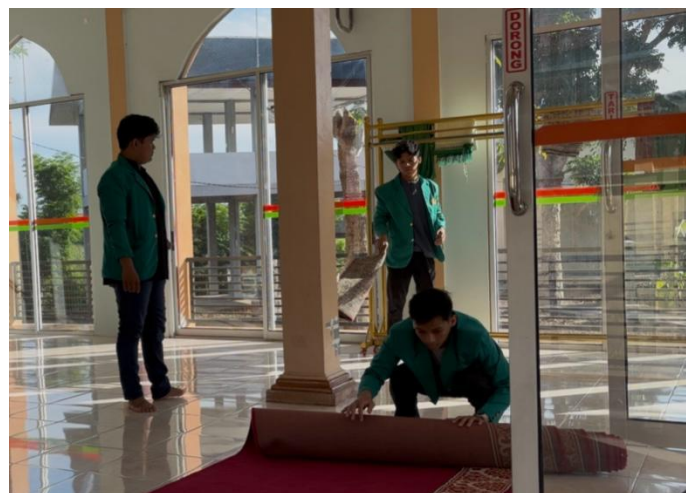
Gambar 4. Pengelolaan Kebersihan Meunasah

Membersihkan balai desa adalah salah satu Langkah penting untuk meningkatkan kenyamanan aparatur desa dalam melakukan kerja di balai desa. Kegiatan ini perlu adanya dilakukan secara rutin dalam meningkatkan kesejahteraan aparatur desa.