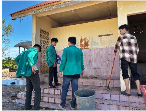
Gambar 5 Kegiatan Membersihkan Area Wudhu dan Toilet

dalam mengelola, merawat dan menjaga kebersihan dan kenyamanan dengan baik. (Ferdiansyah et al., 2022)