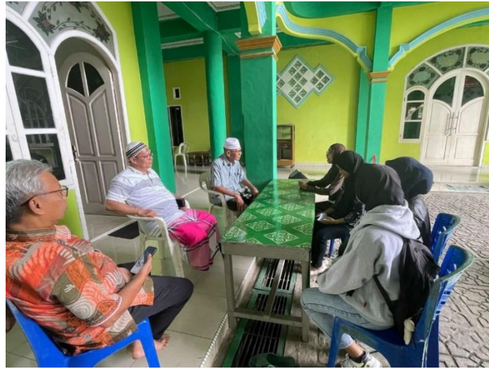
Gambar 1. Dokumentasi saat Diskusi Awal Bersama Pengurus Masjid