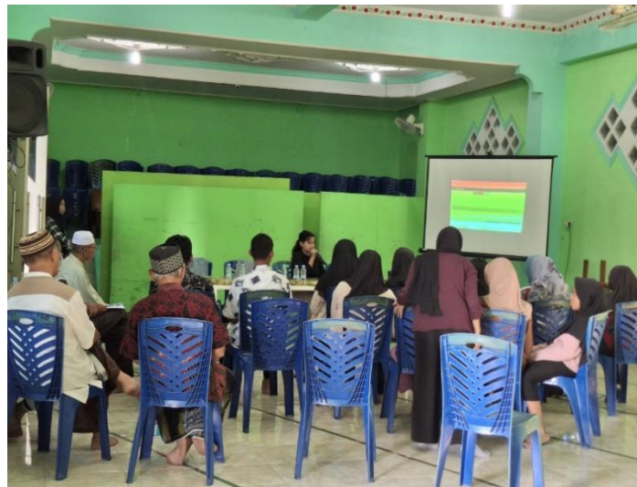
Gambar 2 Dokumentasi saat Kegiatan Pendampingan SIAPIK

Pelatihan dan pendampingan penggunaan aplikasi SIAPIK di Masjid Baitul Makmur menunjukkan peningkatan yang signifikan dalam kemampuan pengurus masjid untuk mengelola keuangan secara digital. Penemuan ini mendukung temuan Alamsyah dan Arman (2023) yang menekankan betapa pentingnya digitalisasi untuk membuat keuangan masjid lebih transparan dan akuntabel. Meskipun beberapa peserta menghadapi keterbatasan perangkat, peningkatan kemampuan dalam mencatat transaksi dan membuat laporan keuangan secara digital menunjukkan bahwa pengurus mampu beradaptasi dengan teknologi yang ditawarkan oleh SIAPIK.