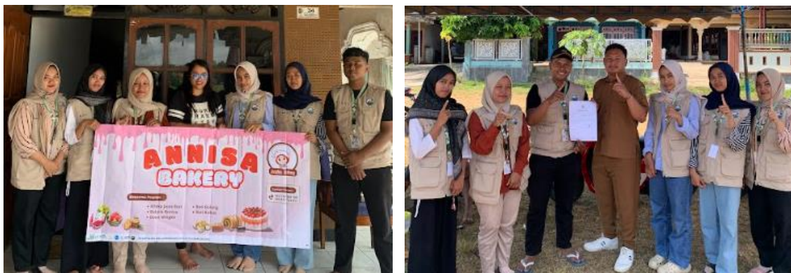
Gambar 4 Kegiatan Penyerahan NIB, Barcode QRIS dan Banner UMKM di Desa Sumberdadap, Kecamatan Pucanglaban, Kabupaten Tulungagung

Langkah pengembangan program pengabdian masyarakat yang terakhir ( Destiny ) yaitu penyerahan NIB, QRIS, dan G-maps kepada pelaku UMKM yang mengikuti program pendampingan. Sebagai pelengkap kegiatan, tim KKN juga menyalurkan banner promosi kepada 19 UMKM di Desa Sumberdadap. Banner tersebut memuat informasi dasar tentang usaha, termasuk, kontak, serta deskripsi singkat produk atau layanan. Keberadaan banner ini menjadi bentuk dukungan promosi visual yang membantu meningkatkan citra profesional UMKM, memperkuat identitas usaha, serta menarik perhatian konsumen secara lokal. Strategi ini dianggap efektif karena mampu menggabungkan unsur digital dan visual dalam mempromosikan UMKM secara lebih luas.