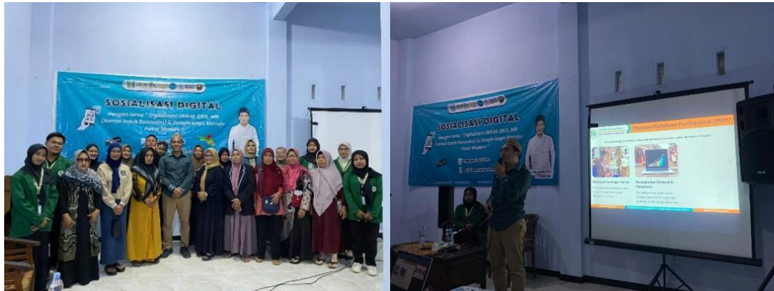
Gambar 2 Kegiatan Sosialisasi Digitalisasi UMKM di Desa Sumberdadap, Kecamatan Pucanglaban, Kabupaten Tulungagung