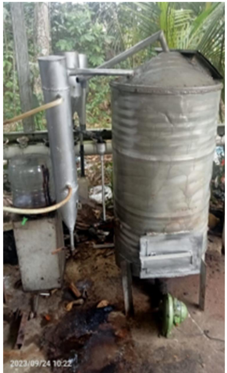
b). Prototype alat