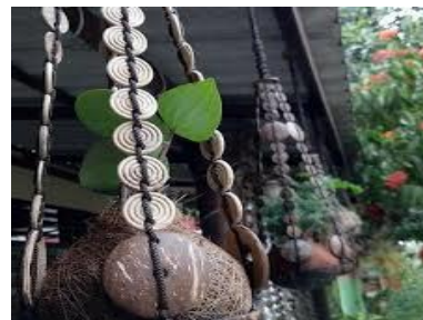
Gambar 12. Teknik Menanam Cocodama yang sedang dikembangkan Kampung Bathok

Mentransferkan ilmu pengetahuan tentang pengolahan limbah kelapa ini memberikan nilai ekonomis pada warga