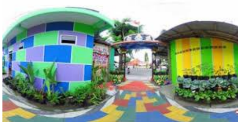
Gambar 8. Suasana kampung 3D Bongares

Sasaran wisatawan sangat bervariasi mulai dari usia sekolah PAUD sampai