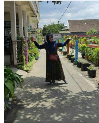
Gambar 5. Suasana Kampung Mint Blitar