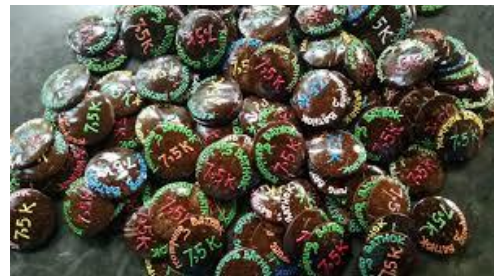
Gambar 11. Gantungan kunci hasil olahan Kampung Bathok