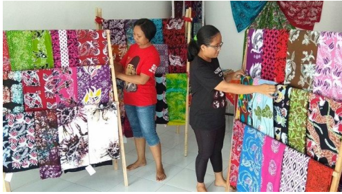
Gambar 2. Contoh-contoh Motif hasil Kampung Batik Turi

Sasaran wisatawan beraneka ragam, berbagai kalangan mulai tertarik dengan paket yang ditawarkan. Wisatawan sasaran yang pernah mencoba paket edukasi ini antara lain mulai dari TK, SD, SMP, SMA, IBU KADER POSYANDU, ODGJ dan lain-lain. Adapun penyesuaian paket wisata edukasi untuk siswa sekolah dengan menyesuaikan permintaan program outing class . Manfaat melestarikan kebudayaan leluhur sangat mendominasi paket wisata edukasi ini, selain itu dapat meningkatkan perekonomian warga masyarakat sekitar lokasi khususnya.