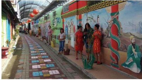
Gambar 9. Suasana setelah pintu masuk Kampung Nirwana Boclent