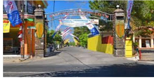
Gambar 14. Pintu masuk Kampung Belimbing Karangsari

Sasaran wisatawan sangat beragam karena lokasi ini banyak diminati semua kalangan. Terlebih letak agrowisata belimbing karangsari terletak dipinggir jalan antar Kota Blitar dan Tulungagung maka akan mudah dikunjungi untuk sekedar mampir membeli oleh-oleh serta dapat sebagai lahan promosi kampung Belimbing yang berada tidak jauh dari lokasi Agrowisata Belimbing Karangsari.