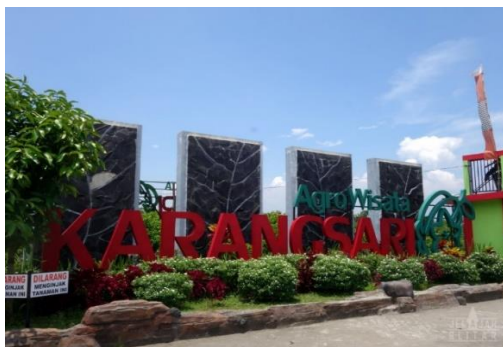
Gambar 13. Agrowisata Belimbing Karangsari