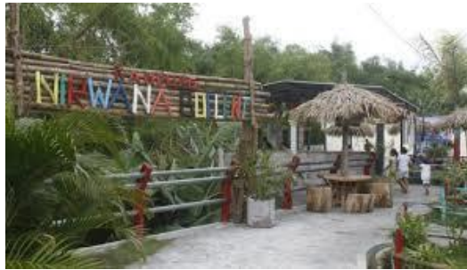
Gambar 10. Taman pinggiran Sungai yang sebelumnya TPS

Wisatawan yang datang ke kampung ini cukup variatif adanya taman bermain di pinggiran sungai membuat menarik anak-anak untuk datang mengunjungi kampung kreatif ini. Selain anak sekolah, wisatwan domestic juga sering menghabiskan kegiatan di taman kampung kreatif ini. Adapun kegiatan paket wisata yang telah ditawarkan para etnis Tiong Hua sudah banyak yang datang untuk belajar ke kampung ini.