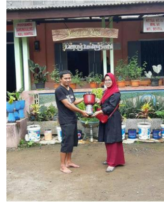
Gambar 4. Hasil Painting Body Jinbe paket wisata Kampung Kendang

Kegiatan Outing class di sejumlah sekolah Kota Blitar dan di luar Kota Blitar mulai memberikan peluang minat wisatawan kampung kreatif Kendang Sentul ini. Mulai dari siswa PAUD sampai Perguruan Tinggi pernah mencoba paket wisata Edukasi ini. Tidak jarang pula berbagai perkumpulan dan Pegawai Pemerintah melakukan kunjungan dan mencoba paket edukasi yang disediakan pengelola.