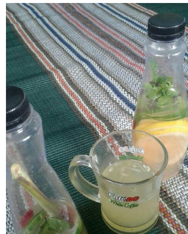
Gambar 6. Infus Water Salah satu produk andalan kampung Mint Blitar

Adanya berbagai paket memudahkan masyarakat untuk menentukan edukasi yang diinginkan, sesuai tarif ataupun menyesuaikan kebutuhan. Sasaran wisatawan disegala usia memberikan peluang untuk semakin meningkatkan perekonomian warga. Selain itu memberikan edukasi tentang tanaman herbal yang sangat bermanfaat untuk wisatawan.