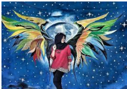
Gambar 7. Salah satu area foto favorit kampung 3D