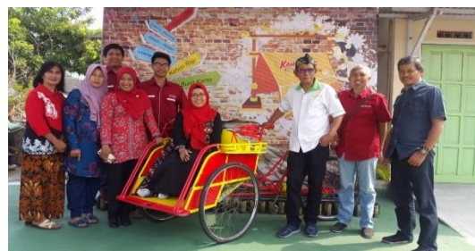
Gambar 3. Area Foto Selfi Kampung Cyber

Wisatawan yang mulai mencoba paket wisata Kampung Cyber juga cukup bervariasi, diantaranya Anak – anak usia sekolah dari PAUD hingga perguruan tinggi,