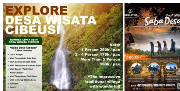
Gambar 8. Homestay Desa Cibeusi