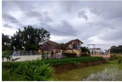
Gambar 7. Homestay Desa Cibeusi