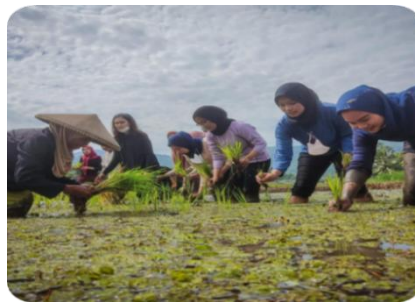
Gambar 3. Menanam di Desa Cibeusi