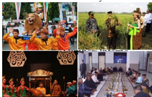
Gambar 4. Wisata Budaya Desa Cibeusi