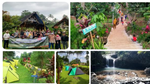
Gambar 2. Wisata Alam Desa Cibeusi