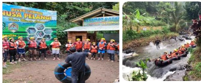
Gambar 6. Wisata Petualangan Desa Cibeusi