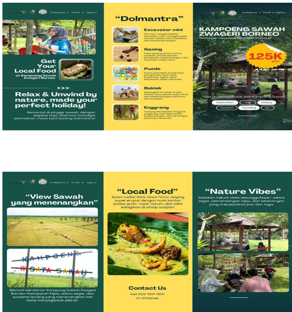
Gambar 2. Brosur Paket Wisata