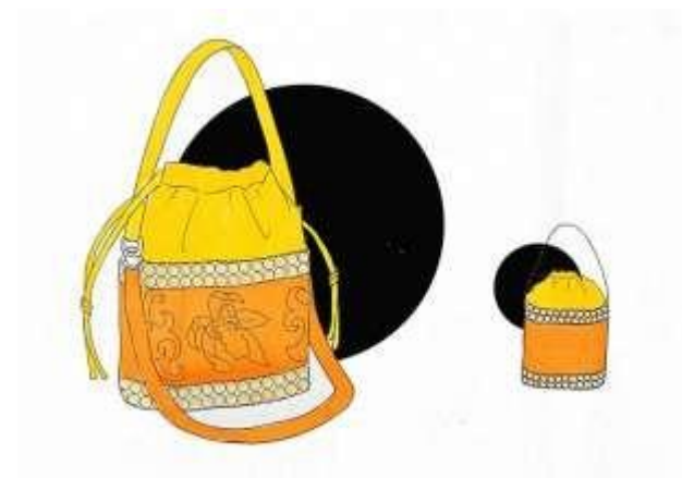
Gambar 4. Alternatif Desain Terpilih

Gambaran awal bentuk produk diberikan oleh desain awal, yang terdiri dari beberapa alternatif desain. Setelah berbagai pertimbangan dilakukan, keuntungan dan kekurangannya dievaluasi sesuai dengan konsep produk. Gambar 4 berikut menunjukkan pilihan desain yang dipilih.