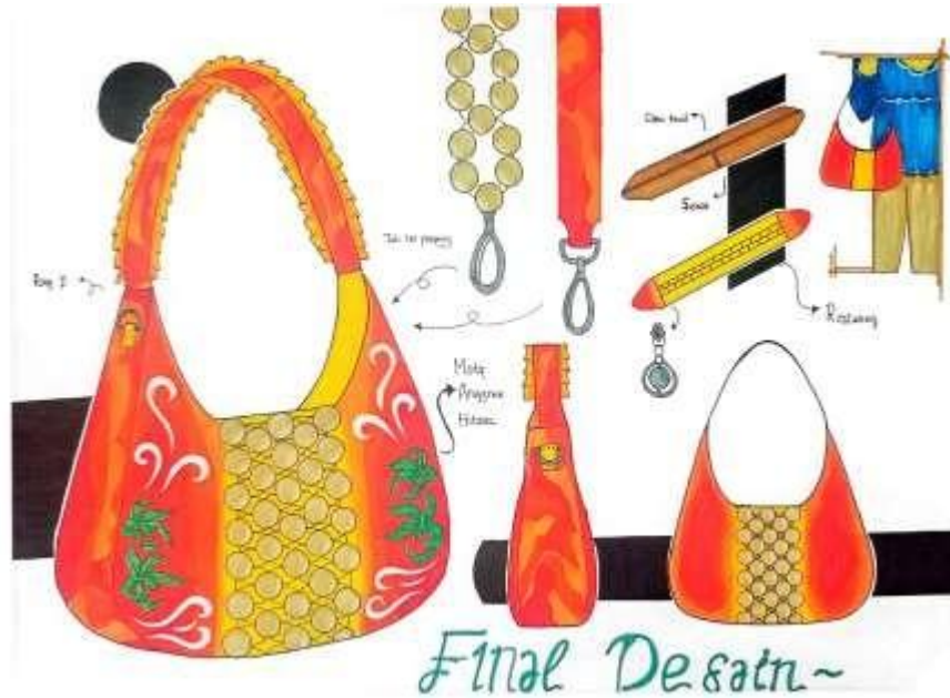
Gambar 7. Desain Final