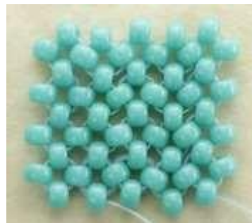
Gambar 3. Sistem Right Angle Wave