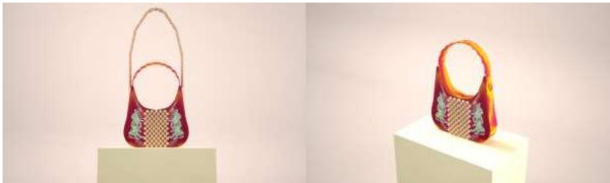
Gambar 8. Gambar 3D