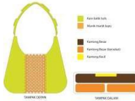
Gambar 2. Analisis Konfigurasi Terpilih

Pada konfigurasi diatas, bagian dalam tas terdiri dari wadah penyimpanan dompet, handphone, charger/powerbank, pouch make up, dan wadah kunci kendaraan. Penyusunan wadah seperti ini mengurangi perubahan bentuk saat tas terisi penuh karena wadah penyimpanan dibuat sesuai dengan dimensi barang yang disimpan.