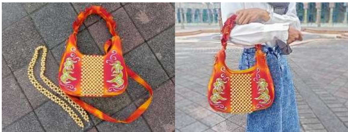
Gambar 9. Prototype Produk

Perancangan tas tangan wanita berbasis batik tulis bermotif anggrek hitam yang dipadukan dengan manik-manik kayu ini menjadi upaya nyata dalam menghadirkan produk fesyen yang tidak hanya fungsional, tetapi juga merepresentasikan kekayaan budaya Kalimantan Timur. Keunikan kombinasi material lokal tersebut menunjukkan