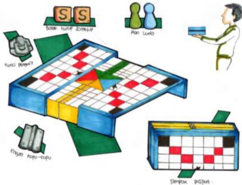
Gambar 3. Final Desain

Desain final ini sama seperti desain pengembangan sebelumnya, tetapi laci diganti dengan wadah kosong di dalam papan ludo. Desain final ini menerapkan warna primer sebagai warna utama yaitu warna biru dan kuning. Warna merah digunakan sebagai warna dominasi yaitu untuk pintu papan penyimpanan bidak dan huruf dan putih digunakan sebagai warna dominasi untuk bagian dalam dari tempat penyimpanan bidak dan huruf