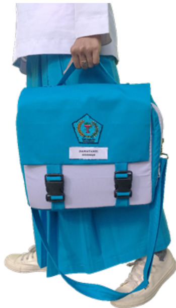
Gambar 3. Prototipe produk