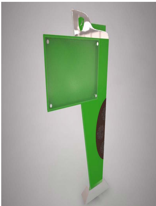
Gambar 3. Final Desain