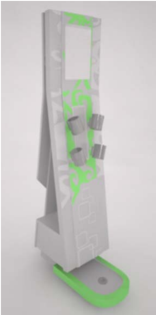
Gambar 2. Modelling produk