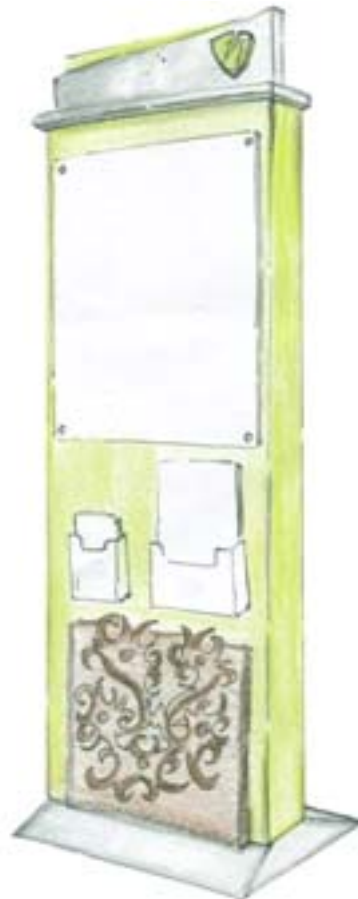
Gambar 4. Pengembangan Desain Alternatif

Desain alternatif terpilih tadi selanjutnya dikembangkan lagi menjadi beberapa desain pengembangan. Selanjutnya beberapa desain pengembangan tersebut dianalisis sejauh mana sesuai dan memenuhi kriteria desain yang telah ditentukan. Dari beberapa desain pengembangan yang telah dianalisis dipilih pengembangan desain seperti yang ditunjukkan dalam gambar 4. Pengembangan Desain dalam gambar 4 tersebut memiliki keserasian bentuk yang lebih bagus sehingga tampilannya terlihat lebih estetik dibanding desain sebelumnya. Pada bagian alas memiliki bentuk seperti segitiga dengan konstruksi yang baik sehingga dinilai dapat menopang bagian utama dengan baik.