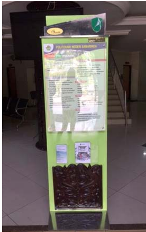
Gambar 6. Prototipe produk