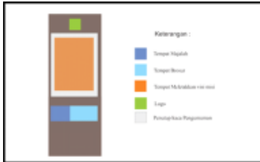
Gambar 1. Komposisi konfigurasi