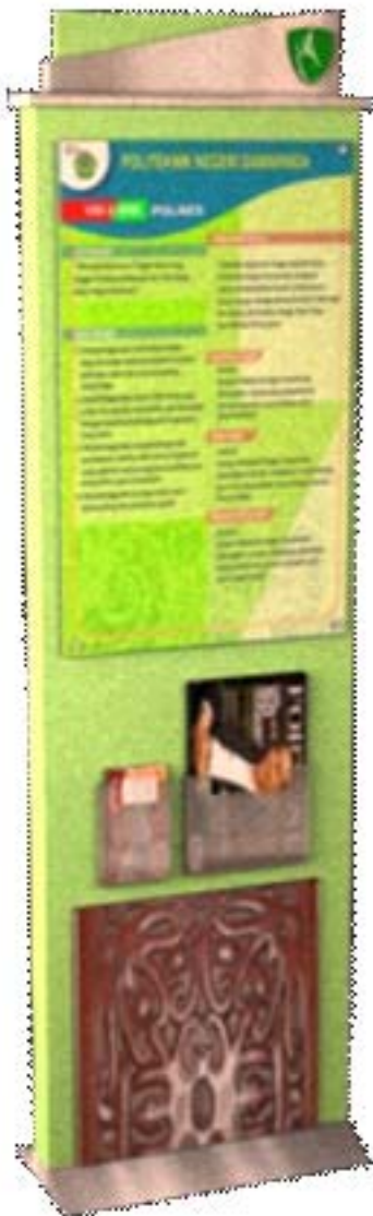
Gambar 5. Desain akhir

Dari desain pengembangan alternatif dari gambar 4, desain alternatif tersebut paling tepat digunakan pada perancangan produk papan visi misi ini. Desain terpilih tersebut dilakukan penyempurnakan sampai menjadi desain akhir, sehingga layak untuk diproduksi. Meliputi spesifikasi teknis, gambar presentasi, gambar teknik, serta rencana anggaran biaya. Desain akhir tersebut ditunjukkan dalam gambar 5, yang diwujudkan dalam prototype produk operasional seperti yang ditampilkan dalam gambar 6.