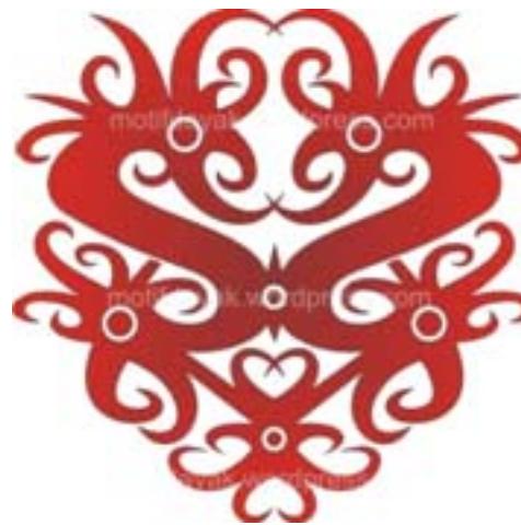
Gambar 2. Motif kalung betiq

Tetapi karena ditambahkan dengan unsur etnik Kalimantan yaitu motif Dayak dan juga menggunakan beberapa jenis material yang berbeda, maka gaya desain yang muncul pada perancangan papan visi misi ini adalah post modern eklektik. Dimana konsep desain eklektik adalah penggabungan gaya dan material menjadi satu kesatuan untuk mencapai tampilan yang estetis.