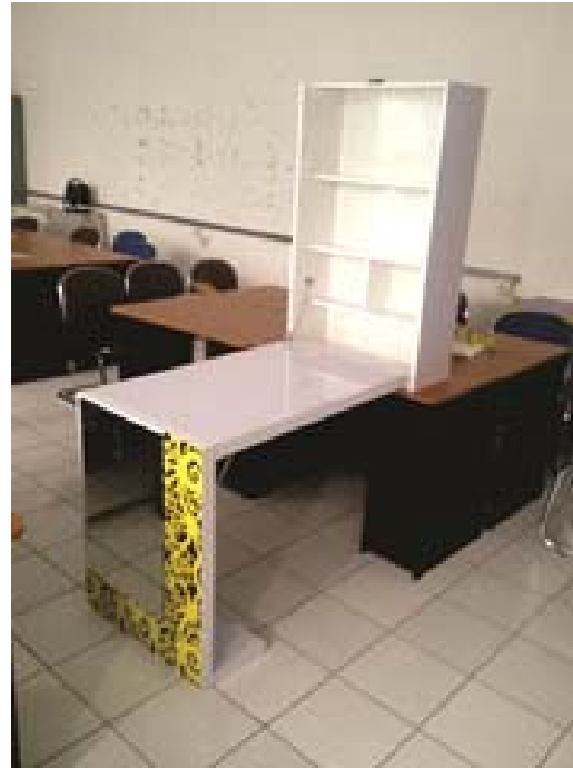
Gambar 5. Prototipe produk