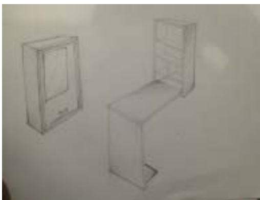
Gambar 3. Pengembangan desain terpilih