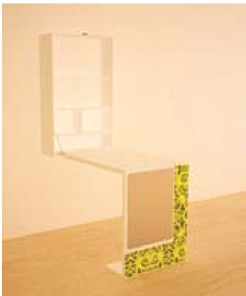
Gambar 4. Gambar presentasi