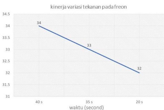
Gambar 4. kinerja freon pada suhu tertentu.

Pada putaran 1500 rpm pengujian kinerja pendinginan AC dengan variasi waktu 20.00s, 35.00s, 40.00s dengan tekanan rata-rata pada pengujian diatas high presure sebesar 150 pso dan low presure 58 psi.