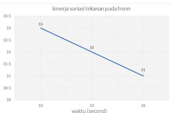
Gambar 3. Kinerja freon pada suhu tertentu

maksimal 25oC saja dalam waktu 16.00 sekon dan maksimalnya 33.00 sekon, dan metode ini dipakai pada pengujian pada putaran selanjutnya.